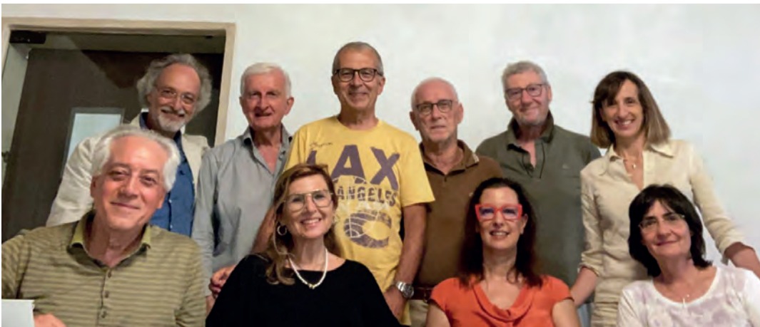
Componenti Commissione n. 5, Cure palliative

Un plauso particolare va ai Colleghi che hanno raccolto questa sfida accettando di far parte della Commissione Approccio palliativo - Cure palliative - Cure di fine vita. Il loro impegno volontario a favore di tutti gli Iscritti all'Ordine è una testimonianza di come la nostra Categoria, anche in una fase così delicata per il Sistema Sanitario, abbia sempre a cuore la Professione, a tutela della salute dei nostri assistiti.