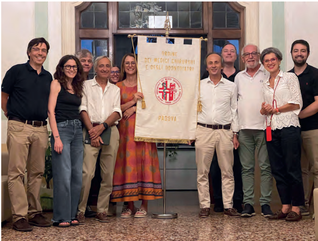
Componenti Commissione n. 14, Consulta medico- legale

Attraverso queste prime attività, la Consulta conferma il proprio ruolo di organismo tecnico-consultivo al servizio della Professione Medica, della tutela del Paziente e del dialogo interprofessionale su questioni complesse e sensibili che coinvolgono Diritto, Medicina ed Etica.