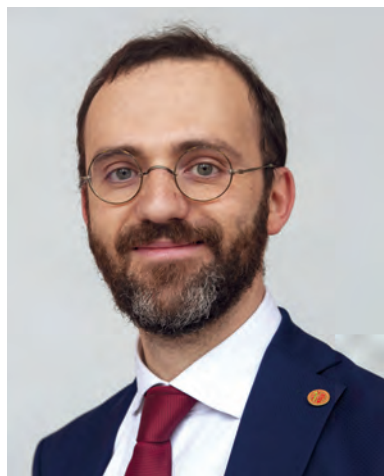
Dott. Filippo Crimi, Presidente Ordine Medici Chirurghi e Odontoiatri di Padova

Permettetemi infine di concludere con una riflessione sulla Professione. Viviamo un periodo storico in cui, come Medici e Odontoiatri, lavorare nel Sistema Sanitario Nazionale è sempre più difficile, sia perché oppressi da eccessivi carichi di lavoro amministrativo, sia per le politiche di contenimento della spesa pubblica, nonché per le nuove esigenze di una popolazione in continua evoluzione. Alcune recenti proposte normative, a mio avviso negative, rischiano di incidere profondamente sul futuro della nostra attività. Per mantenere indipendente, credibile e forte la nostra Professione, è fondamentale che tutte le componenti del mondo medico e odontoiatrico – dipendenti pubblici e privati, convenzionati e liberi professionisti – lavorino insieme per riaffermare la centralità del nostro ruolo e del rapporto tra Professionista e Paziente. Solo così potremo convincere le Istituzioni e la Politica che investire nella formazione di professionisti sanitari e nella riorganizzazione del sistema sanitario oramai obsoleto è la via maestra per tutelare la Salute comune. Come Ordine di Padova, ci impegniamo a muoverci con determinazione in questa direzione.